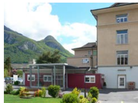
AIGLE – Urgences mère et enfant jusqu'à 16 ans. En cas de problème gynécologique ou obstétrical chez la femme et pour toutes les urgences chez l'enfant.