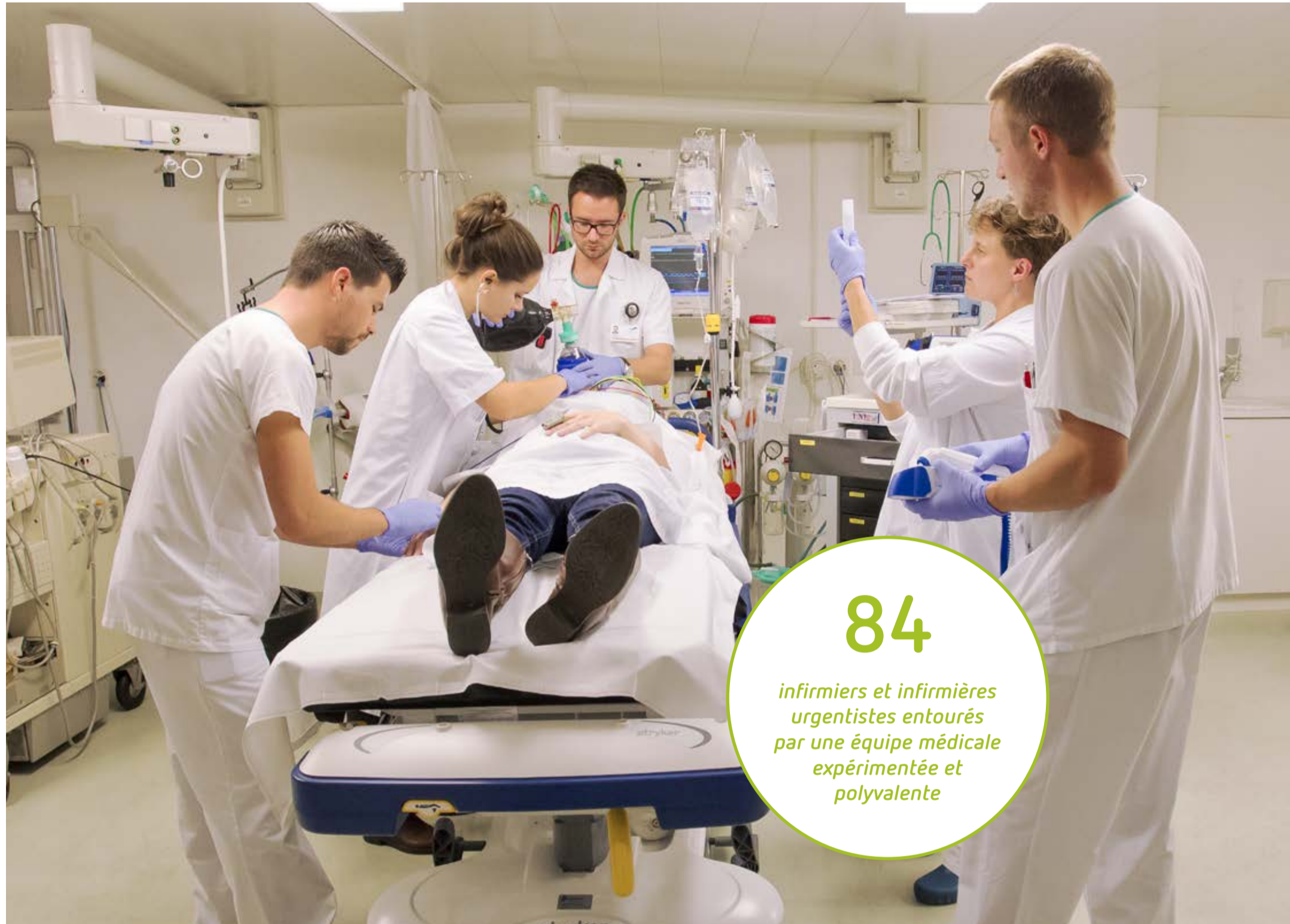
A l'image, des membres de l'équipe des urgences de Montreux autour d'une patiente en salle de déchochage.

65'000 patients (adultes et enfants confondus) reçus en 2014