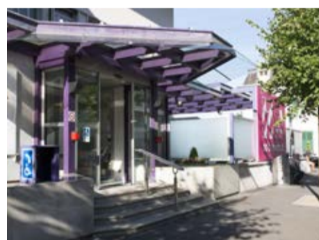
MONTREUX – Urgences chirurgicales, urologiques et traumatologiques adultes. En cas d'accident impliquant par exemple chute, fracture ou coupure.