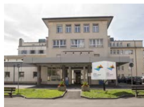
VEVEY SAMARITAIN – Urgences médicales, ORL et gynécologiques adultes ainsi que les urgences médico-chirurgicales pédiatriques. En cas de maladie chez l'adulte ; en cas de problème gynécologique ou obstétrical chez la femme et pour toutes les urgences chez l'enfant.