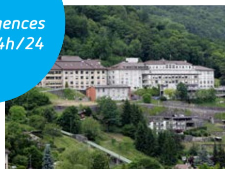
MONTHEY – Urgences médico-chirurgicales chez l'adulte (dès 16 ans). Pour tout problème de santé.